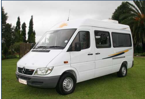
Delux Campervan für bis zu 2 Personen