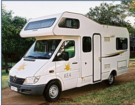
Delux-Reisemobil für maximal 5 Personen