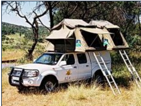
Nissan Geländewagen für 4 Personen