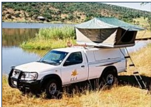
Nissan Geländewagen für 2 Personen