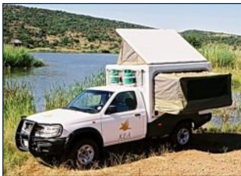
Nissan Geländewagen für 2 Personen