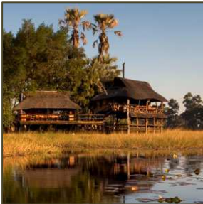
Wohnbeispiel Okavango Delta